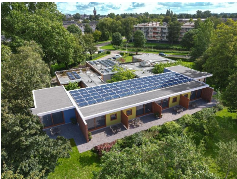
Artist impressie beoogde eindresultaat

De architect had op verzoek van het bestuur een aantal schetstekeningen gemaakt van hoe de uitbreiding met twee gastenkamers en het vergroten van de bestaande gastenkamers eruit zouden kunnen gaan zien. In drie inloopsessies zijn de schetsen voorgelegd aan de vrijwilligers. Ook buurtbewoners waren betrokken bij de plannen. Zij konden ook suggesties doen. Reacties, wensen, ideeën en vragen over de uitbreiding werden geïnventariseerd. Tijdens thema-avonden met vrijwilligers werden alle op- en aanmerkingen, wensen en suggesties uit de inloopsessies besproken. Het scrumteam is hiermee aan de slag gegaan en heeft de wensen vertaald in een Programma van eisen (PvE). Dit PvE was voor de architect de basis waarmee hij aan het werk kon.